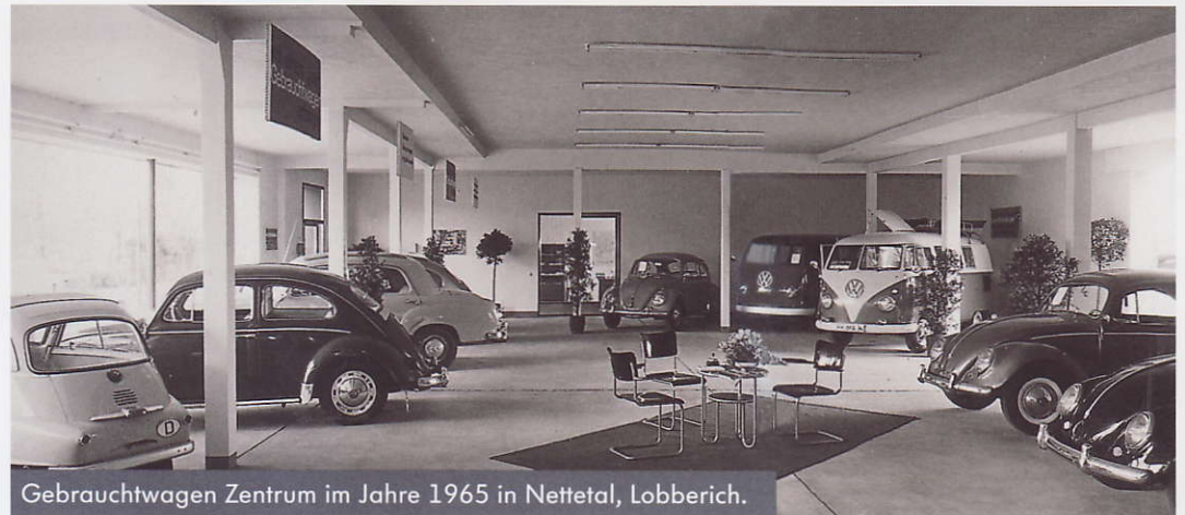
Gebrauchtwagen Zentrum im Jahre 1965 in Nettetal, Lobberich.